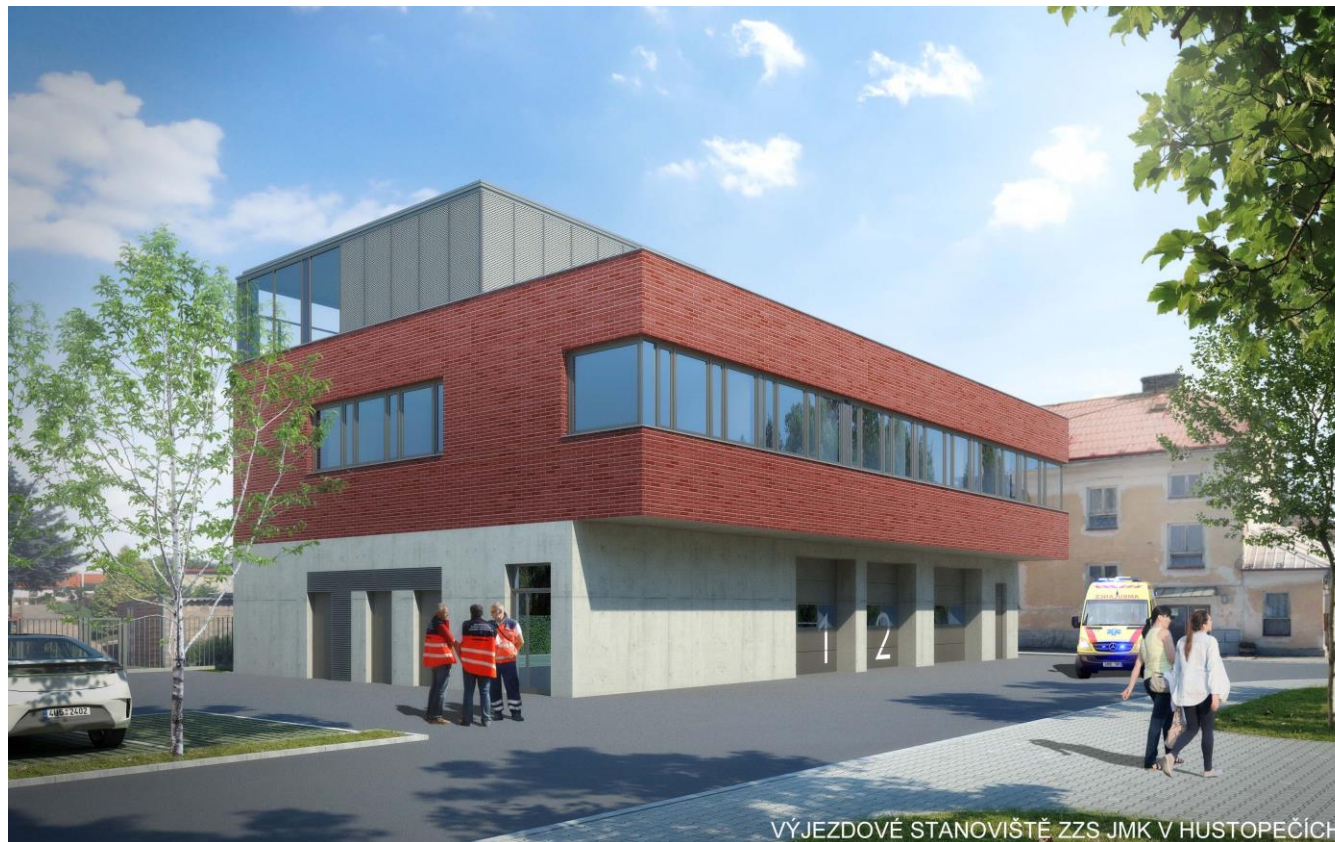
VÝJEZDOVÉ STANOVIŠTĚ ZZS JMK V HUSTOPEČÍCH